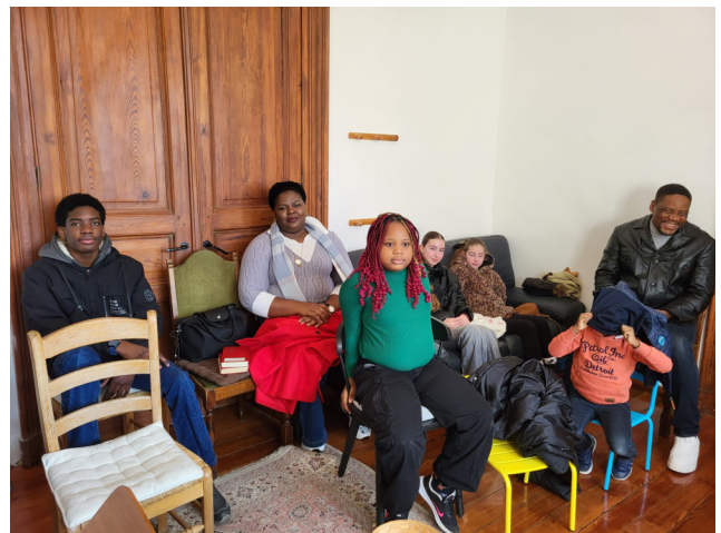
Culte bilingue du 15 février 2026 : 11 enfants et jeunes, et 11 adultes. Parmi eux, deux fidèles familles hollandaises !