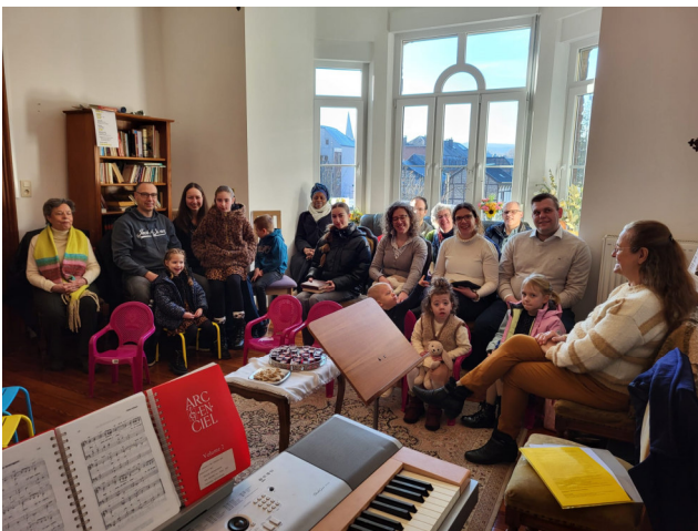
Culte du 8/2 : autant de jeunes que d'adultes ! Et pas d'âge pour l'orgue !