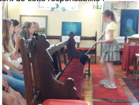
Offrande collectée par une jeune Hollandaise (7/8)

Le temps était radieux, chaque café-crêpes-après culte s'est déroulé dans la joie à l'extérieur. Et bien souvent pendant ou après, des frères et sœurs revenaient dans l'église pour chanter des cantiques ~