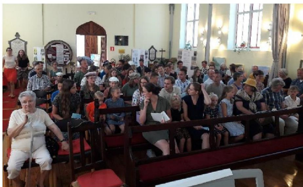
Assemblée du 24 juillet 2022