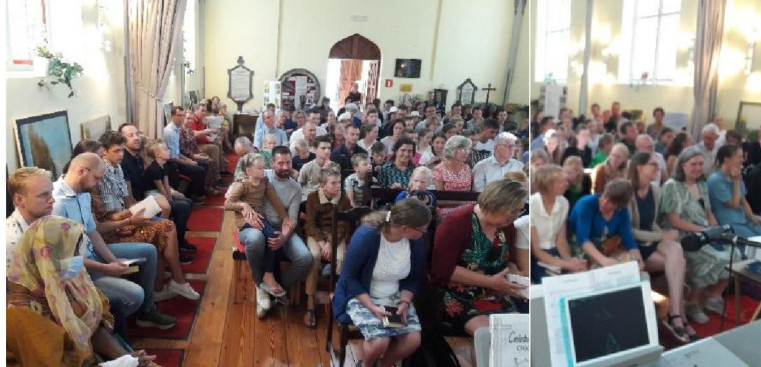
Assemblée du 31 juillet 2022

Un pianiste ou organiste était sollicité pour tenir l'orgue, et ce fut toujours le cas ! Le panier de l'offrande était confié pour la collecte à un enfant hollandais, tout content de cette responsabilité !