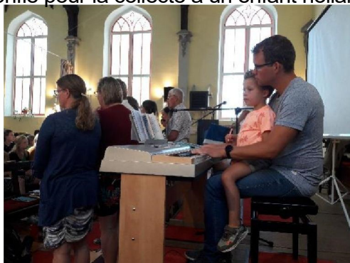
Organiste accompagnant une chorale NL (31/7)

Un pianiste ou organiste était sollicité pour tenir l'orgue, et ce fut toujours le cas ! Le panier de l'offrande était confié pour la collecte à un enfant hollandais, tout content de cette responsabilité !