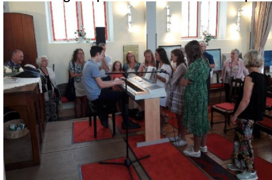
Cantiques d'après-culte du 21 août